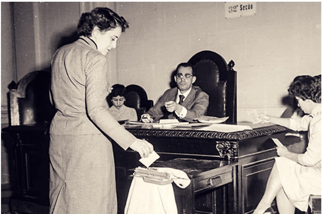
Registro de 1955 — eleitora vota para presidente da República, na cidade do Rio de Janeiro: direito arduamente conquistado

Durante séculos vários sistemas democráticos pelo mundo foram se reinventando, se aperfeiçoando e se consolidando como o mais adequado ao mundo moderno. No Brasil, só em 1894 os brasileiros puderam escolher nas urnas um Presidente da República, em uma eleição com 205 candidatos presidenciais para uma população de 14,3 milhões, onde somente 800 mil estavam habilitados a votar, 5,6% da população. “O direito ao voto era negado a mulheres, analfabetos, mendigos, soldados rasos e religiosos sujeitos a voto de obediência. O eleitor devia ter ao menos 21 anos” (Fonte: Agência Senado, 03/10/2014) [7] .