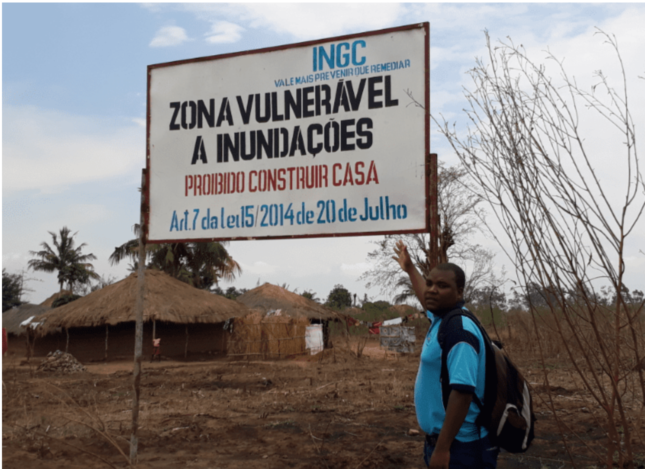
Figura 03. Distrito de Mocuba, margem do rio Licungo.

É preciso assumir-se que os desastres são produtos das decisões do Homem e não dos eventos naturais. A forma como se planifica o uso territorial, o material e a qualidade de infra-estruturas e a consciência comunitária sobre as consequências de um evento natural extremo terminam a magnitude de desastre de uma comunidade. A figura 03 mostra um dentre vários exemplos possível de encontrar ao longo de Moçambique e de outras partes do mundo em que se invade as planícies de inundações fluviais para actividades industriais e habitação.