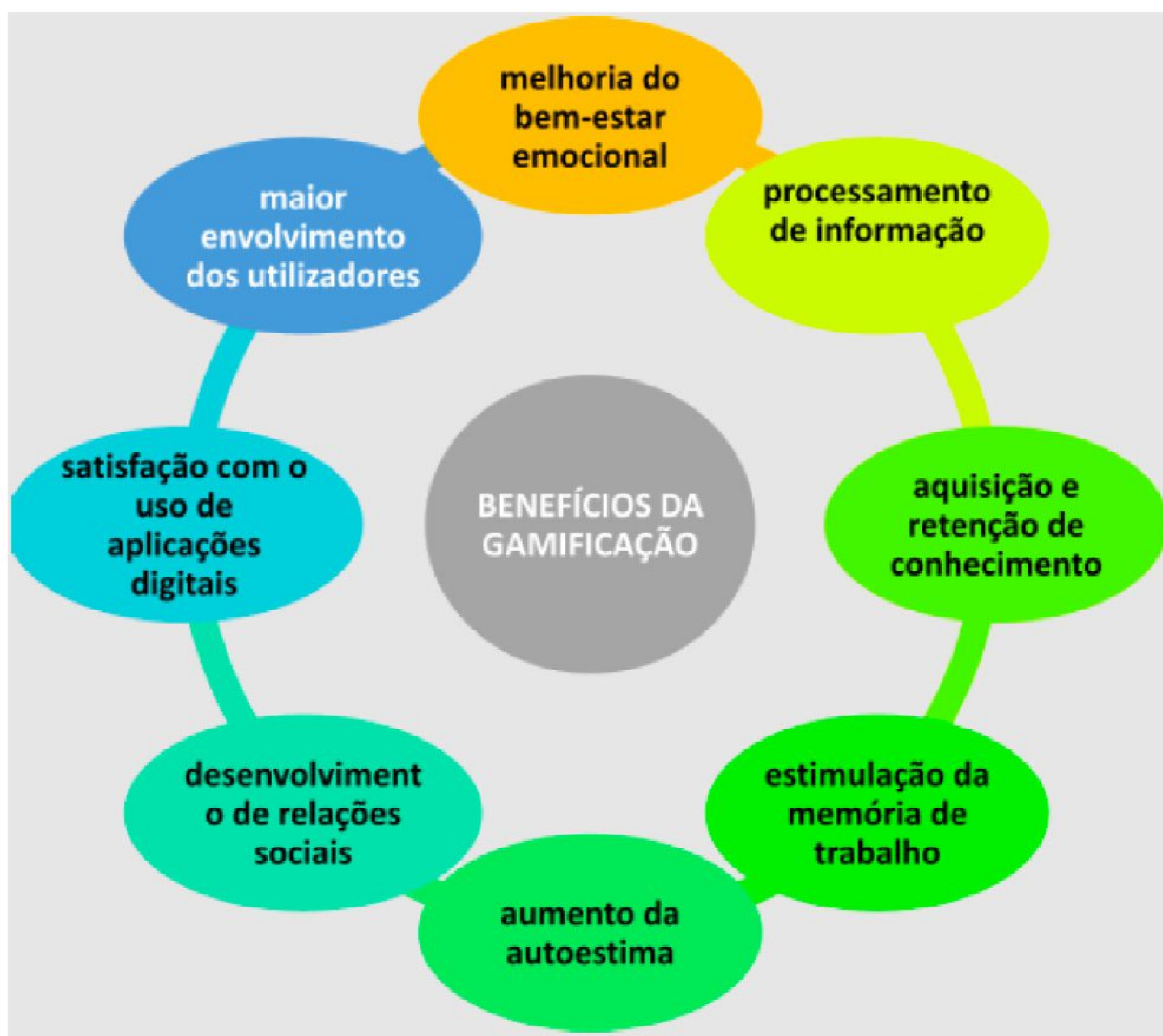
Figura 1. Benefícios da gamificação