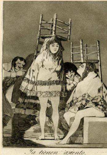
Ya tienen asiento.