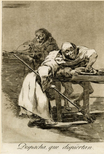
Despacha, que despierten.