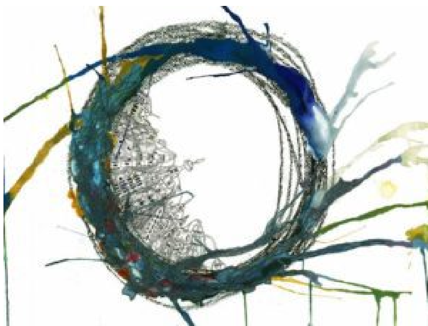
City #8: Vaddoi : uma cidade autossustentável

Como a cidade depende do momento, os cidadãos devem escolher rotas que aproveitem as encostas e evitem aqueles que os levam a bolsos dos quais nunca poderão voltar. (...)”